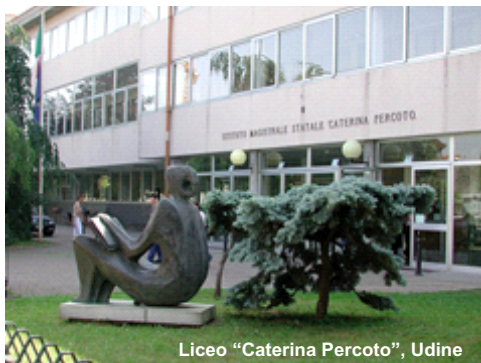
Liceo "Caterina Percoto", Udine