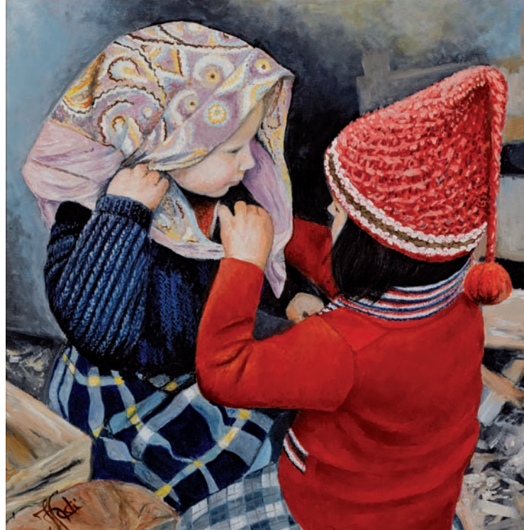
Mirella Venturini Chalet Canadien , 2002