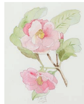
Ivana Cedulini Camelia , 2008