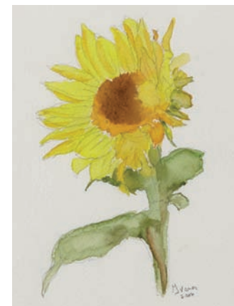
Ivana Cedulini Girasole , 2007