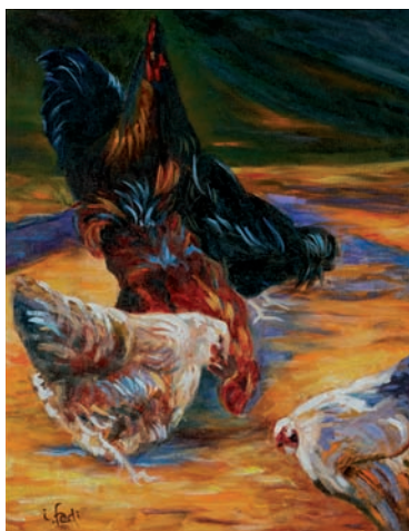
In alto: Irene Fadi Le amiche , 2009